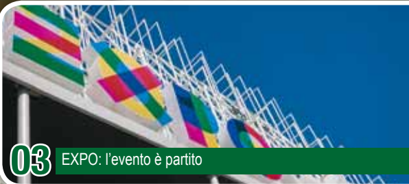
03 EXPO: l'evento è partito