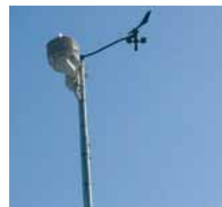
Fig.1. A sinistra: visione del programma di supervisione per la gestione del clima in serra Agrocontrol. A destra: centralina meteorologica esterna montata presso l'azienda Facollo di Albenga,