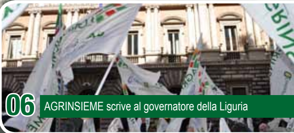
06 AGRINSIEME scrive al governatore della Liguria